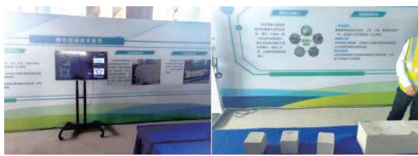
图 17: 绿色低碳技术应用 图 18: 双碳管理平台及再生石砼技术