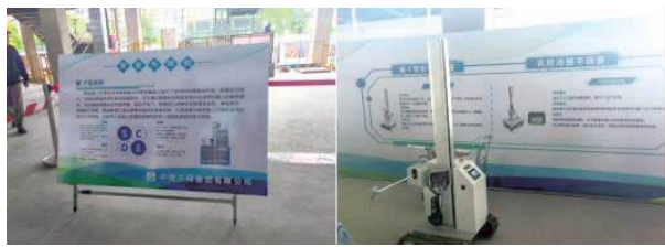
图 1: 智能升降机 图 2: 乳胶漆整平设备

本世纪是科技高度、快速发展的一个世纪, 主要的突破与创新体现在智能化的推广、应用与普及。小到我们社会万家的生活日常, 大到各行各业的高质量发展都在突出“智能”这一重点。扫地机器人现在已经快速成为家庭地面清洁的首选, 实体制造运输业的组装、焊接、运输等步骤也将机器人作为了主力军。智能机器、设备相较于人工有非常多的优势, 比如: 高精度的把控、高品质的制造, 高速度的反应、高平稳的运行。这些优势受外界影响小且能够批量的进行。反观建筑业, “多、杂、乱、品质受环境影响因素大等”弊病已深入人心, 且难以在较短时间内进行彻底的改变。但智能建造将为建筑业打破这一 桎梏。本次观摩会展示了非常多的智能设备, 比如: 安全智能设备、腻子智能喷涂设备、乳胶漆平整设备、智能整平抹平设备、智能运输设备、智能升降机、视觉采集机器人、AI 巡检机器人、除锈机器人、焊接机器人、实测量具机器人、抹光机器人、体检机器人等等。这些 智能设备、机器的投入和运用将为建筑业注入新鲜的血液, 将打破人们一贯的思维, 开拓了视野, 为安全、人文关怀等工作保驾护航。更难能可贵的是智能化在推动建筑业高质量发展方面效果显著, 为建筑业赋予了新的生命。