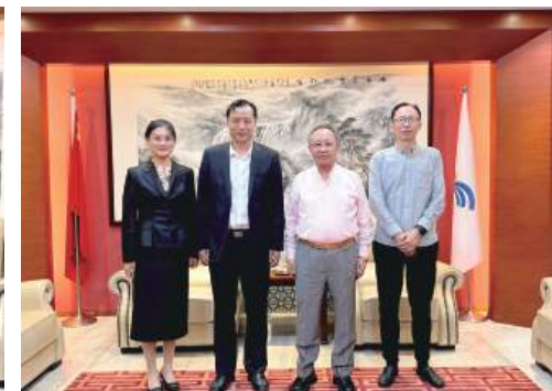
府将一如既往地支持企业发展,为企业提供更加高效、便捷的服务,帮助企业解决发展中遇到的困难。徐普宝书记对森信集团在促进地区经济发

热情接待了徐普宝书记一行。双方进行了亲切而深入的交谈。梁主任详细询问了企业在当前发展过程中遇到的问题,并进行了交流。她表示,街道政