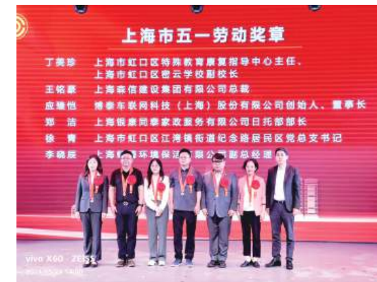
5月23日下午,“礼赞劳动者、奋进新时代”2024年虹口区五一先进表彰会在嘉兴路街道社区文化活动中心举行!