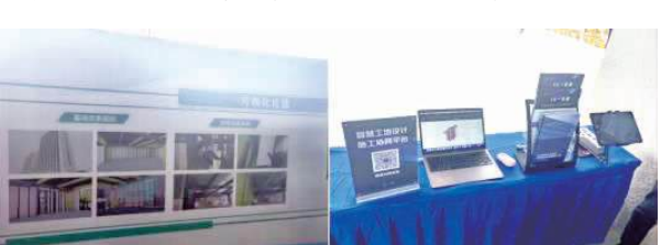
图 13: 可视化比选技术 图 14: 智慧工地设计、施工协同平台