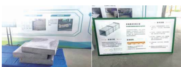
图 19: 石塑胶凝保温材料 图 20: 多晶莫来石耐火板材料

本次观摩会不仅在以上三个方面凸显出管理的创新性、科学性。在标准化设计、精细化管理等诸多方面也均体现出了承办单位在日常安全管理、质量管理中的优势性、创新性、独到性, 值得我们深刻学习与深思。