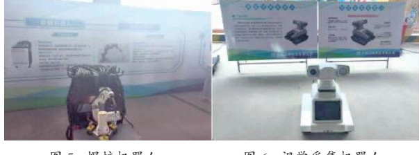
图 5: 焊接机器人 图 6: 视觉采集机器人