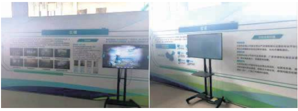
图 7: 云维 图 8: 云采

数字技术、AI 技术正在一步步的改变我们日常的生活, 大数据为信息的采集、筛选提供了更多更广阔的空间, 云技术为生活工作带来了更便捷的操作。那么在建筑业能不能也加入数字技术来为建筑业技术增成本呢? 答案是肯定的! 本次观摩会就全面详细的展示了非常多的数字技术。云维、云采、云砼、云筋等云平台的建立、运用能够提高材料使用的精准度, 降低成本幅度, 提高质量保障。BIM+AI 施工进度管理平台能够准确、高效的为进度管理提供“灯塔”作用。数字化配模技术分区域、分流水段进行模板量计算, 确保施工过程中模板资源的合理利用和周转。可视化比选技术让人们能够直观的感受新技术、新材料、新设备的应用为生产生活带来的便利。智慧工地设计、施工协同平台为多专业协同合作提升了高度和效率。3D 建模一览通平台为整个项目的开发运作提高了可靠性。工程现场数据管理平台为数据管理提供了快捷、便利、准确的操作可能性。5G 塔机技术使得单人可操作多台塔机进行综合管控, 节省人工, 实现高效智能管控。这一系列的数字技术为建筑业赋予了更高的能量, 也提高了企业的核心竞争力。