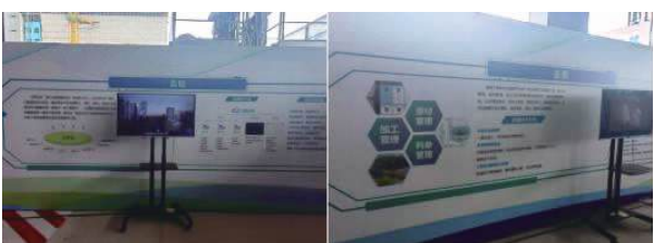
图 9: 云砼 图 10: 云筋