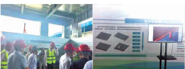
图 11: BIM+AI 进度管理平台 图 12: 数字化配模技术