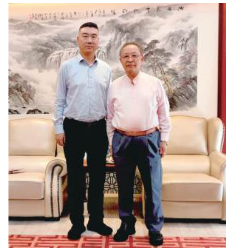
5月24日上午,虹口区建管委党组书记、主任罗隽,副主任章洪庆等领导一行莅临集团总部调研指导。

罗隽主任对森信集团在履行社会责任方面所做的努力表示肯定,并就一些具体事宜进行了交流。他指出,随着虹口区城市建设的不断推进,对高品质、高效率的管理和服务需求日益增长,希望森信集团能够积极响应,充分发挥自身施工管