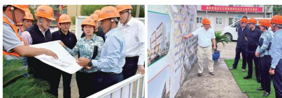
等,并复建澄衷中学历史风貌、华兴坊里弄风貌和沿街风貌。图并文/同济大学117项目部冯燕

此次调研活动体现了虹口区政府对117街坊新建学校项目建设的有力支持,森信建设将继续保持高度的责任感和使命感,确保项目建设的圆满完成,为同济大学附属澄衷中学师生创造一个更好的学习和生活环境,为虹口打造“上海北外滩、都市新标杆”作出新的更大贡献。 北外滩117街坊新建学校项目为同济大学附属澄衷中学新址,占地面积29236平方米,总建筑面积80539.38平方米,地上新建初、高中部,图书馆(世美堂),综合楼(蒙学堂),宿舍(华兴坊),室外平台,体育配套用房,钟楼,门卫室以及室外运动场、绿化等。地下部分新建食堂、风雨操场、游泳池、机动车库、非机动车库、设备用房