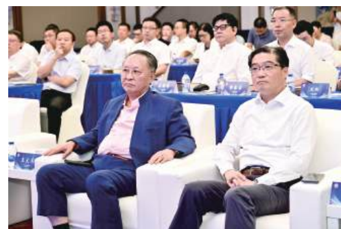
8月17日下午,北外滩企业家联谊会成立大会在上海召开。上海市虹口区委书记李谦,上海