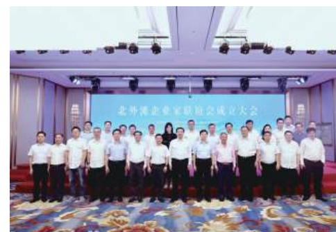
现代服务业联合会会长孙建平,虹口区常委、统战部部长郑宏等出席会议。