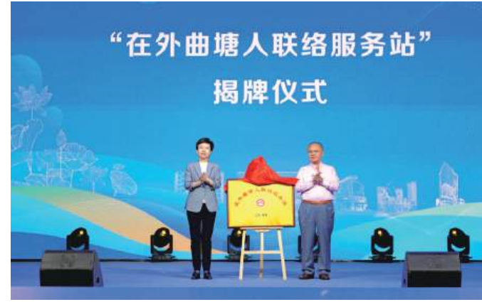
10月2日下午,曲塘镇举行了高质量发展大会,旨在汇聚各方力量共谋曲塘镇高质量发展新篇章。