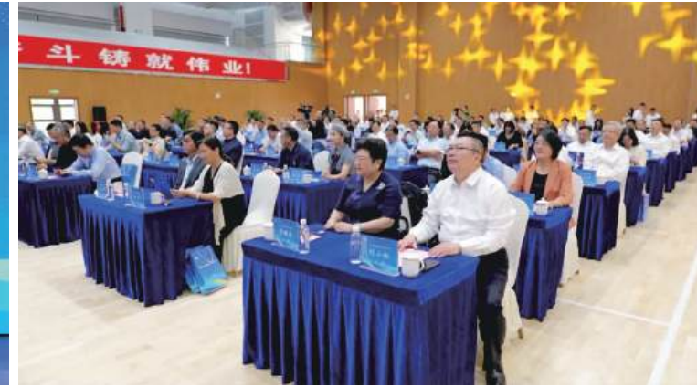
中国工程院院士、首都医科大学副校长吉训明,南京师范大学党委书记王成斌,同济大学常务副校长吕培明,上海森信集团董事长、上海市