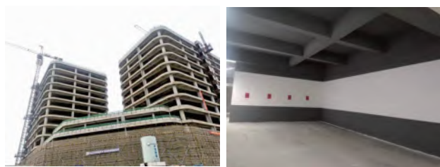
主楼北立面 负一层东区涂料样板

项目部所有成员将继续秉承谦虚谨慎、戒骄戒躁、时刻警惕,积极向上的心态。发挥团队优势,为森兰 D3-2 项目争创“白玉兰”品牌目标,添砖加瓦、贡献应有的力量!