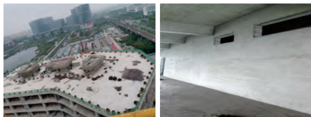
1#楼屋面鸟瞰图 东区主楼室内墙面抹灰