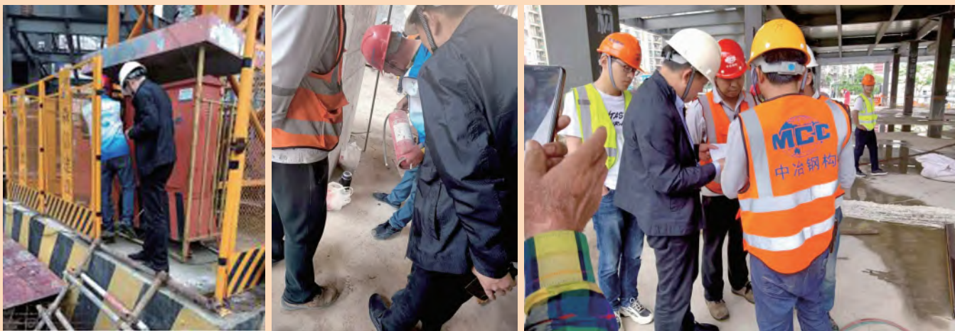
红五月及安全生产月活动方案

项目部每周定期组织监理、专业分包、劳务分包等单位的安全专职管理人员、特殊工种对现场大型机械、临时用电、临边及洞口防护、消防器材、危险性较大的分部分项工程等进行安全专项检查,及时进行隐患排查和整改落实。